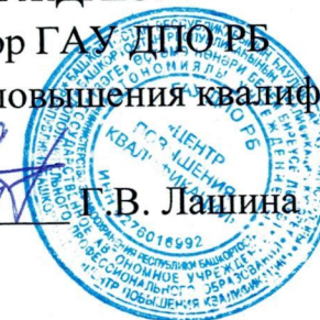
График проведения циклов повышения квалификации для специалистов со средним медицинским и фармацевтическим образованием на 2023 г.

УТВЕРЖДАЮ: Директор ГАУ ДПО РБ «Центр повышения квалификации» Г.В. Лапина